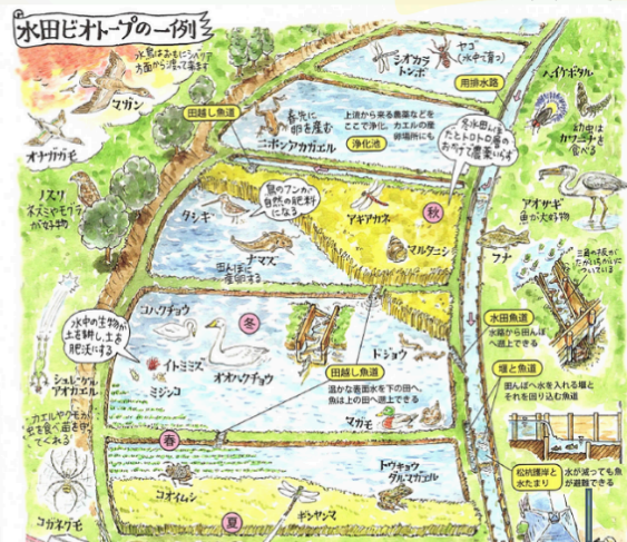
イラスト：大内正伸氏「楽しい山里暮らし実践術」より(2013)

温かいタッチの手書きで描かれた、生物や木々の様子、わかりやすい作業風景など、心温まるイラスト展を是非ご覧ください！